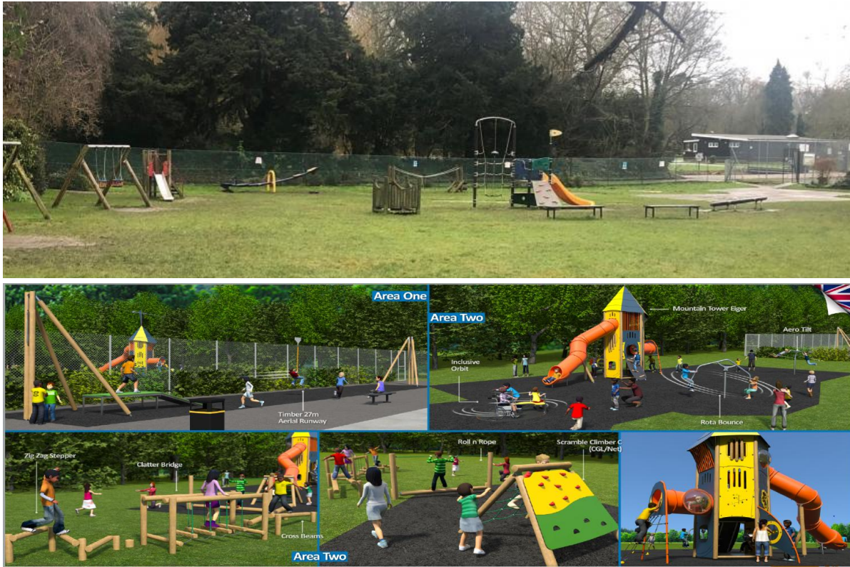
〈그림 9〉 크라우드펀딩을 활용해 주민주도로 공원 재정비사업을 추진 중인 영국 Priority Park