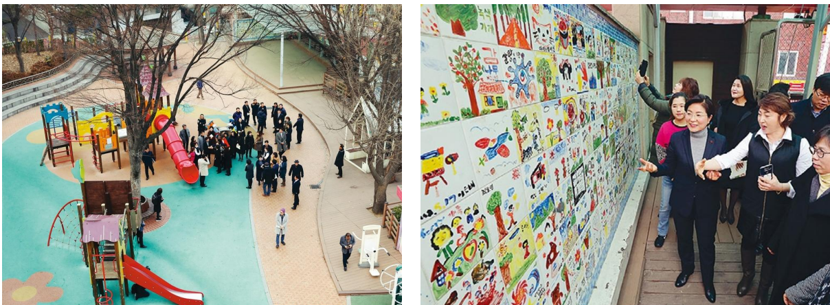
〈그림 10〉 주민참여예산을 활용해서 재정비사업을 추진한 서울 은평구 갈곡리 어린이공원

자료 : 서울(2019), “갈곡리공원의 ‘기적’… 쓰레기 놀이터에서 주민참여 공간으로”, 1월 24일 기사.