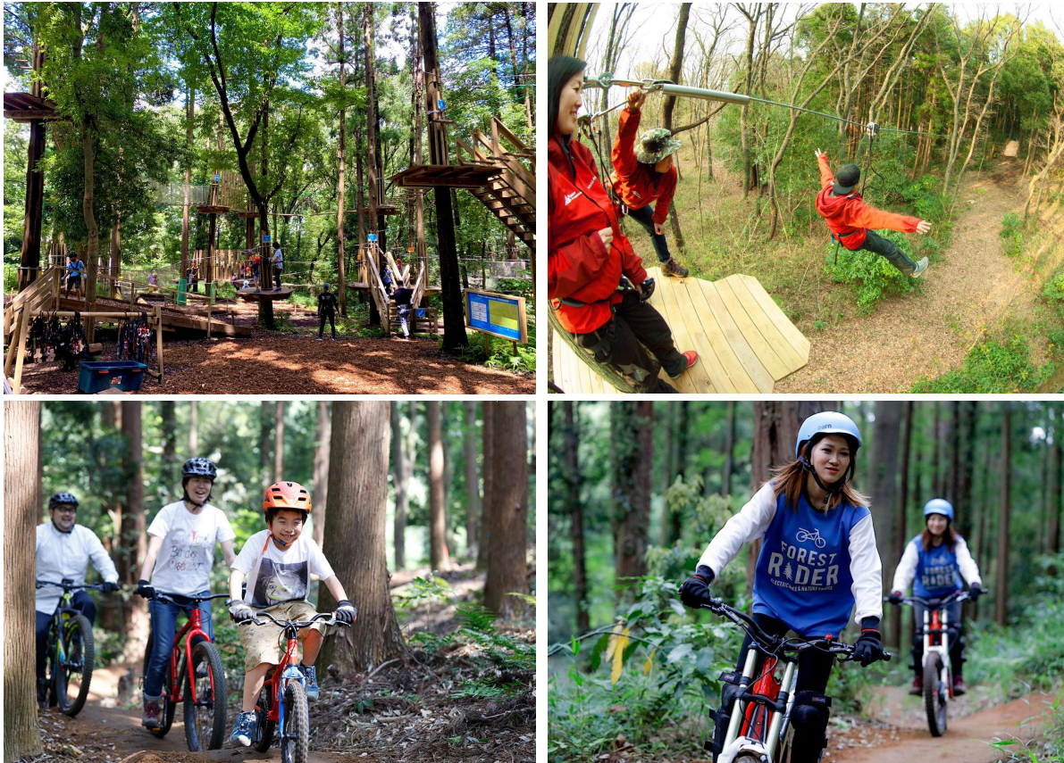
〈그림 6〉 일본 Park-PFI 사업을 통해 시설 조성 + 공원 재정비 사례 (Forest Adventure Yokohama)