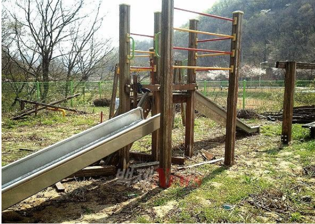
〈그림 1〉 안전을 위협하는 노후된 어린이공원 (좌), 중심부가 썩어 부러질 우려가 큰 위험수 (우)