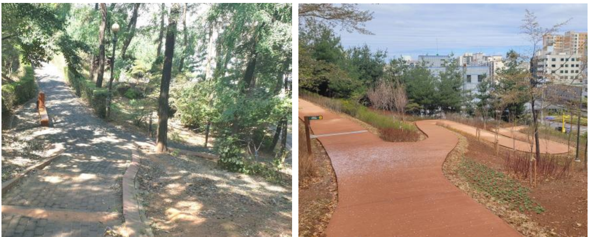
〈그림 4〉 양천구 넘은들공원 재정비사업 전후 변화