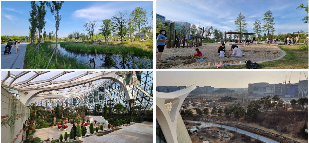
〈그림 3〉 최근 조성되어 시민들에게 매력적인 공원 서비스를 제공하고 있는 서울식물원 공원(2019년 조성)