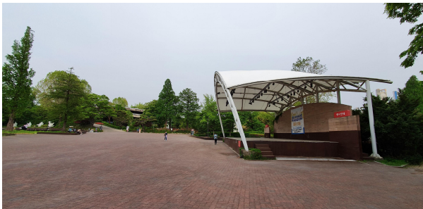
〈그림 2〉 노후화로 인해 장소적 잠재력을 충분히 발휘하지 못하는 서울 어린이대공원(1973년 조성)