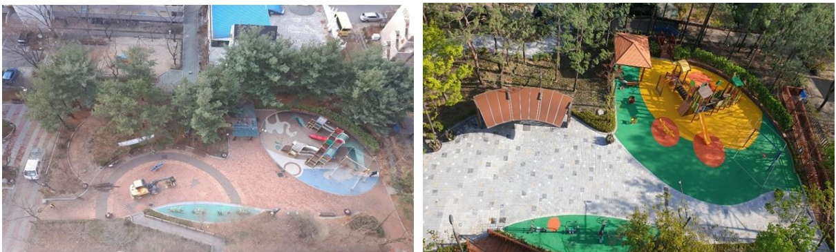
〈그림 5〉 중랑구 꽃피울 어린이공원 재정비사업 전후 변화