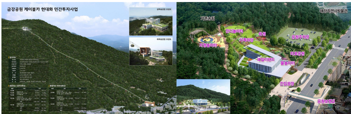
〈그림 7〉 민간투자를 활용해서 추진 중인 부산 금강공원 재정비사업 [케이블카(좌), 유희시설(우)]