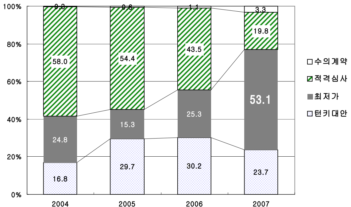
<그림 1> 공공공사의 입찰 방식별 비중 추이