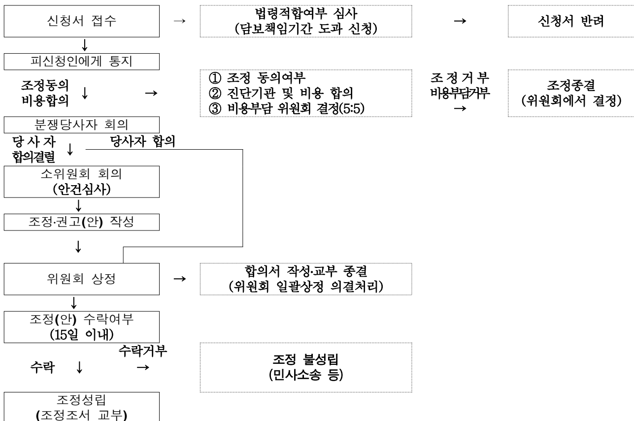
〈그림 2〉 현행 하자심사분쟁조정 처리 절차

- 그 결과 2008년의 주택법 개정과 함께 하자심사분쟁조정위원회가 신설되어 인선 등 조직구성을 끝낸 후 2009년 하반기부터 구체적인 조정업무를 담당하고 있음.