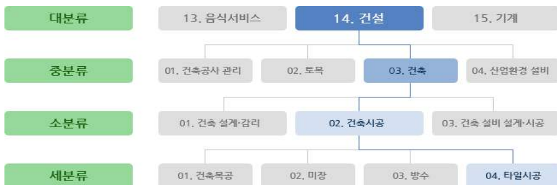
<건설 분야 국가직무능력표준(NCS) 분류체계 예시>

자료 : 국가직무능력표준(www.ncs.go.kr), 'NCS 분류체계' 참조