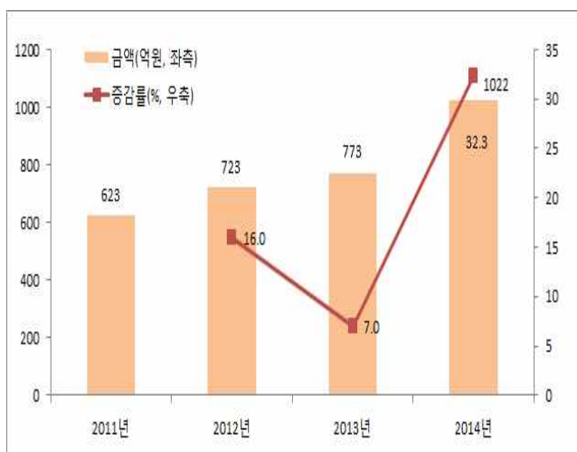
<그림1> 건설업계 사회공헌활동 지출액 추이