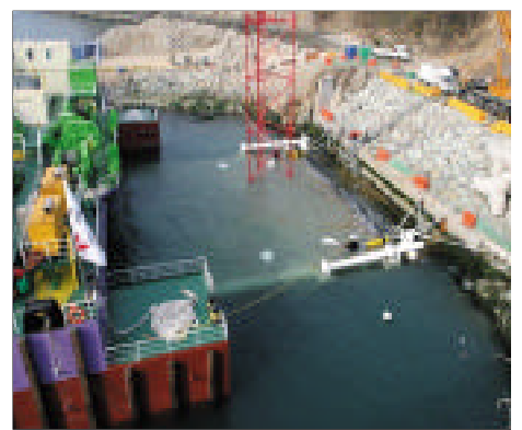
( ) , ( ) , ( ) .