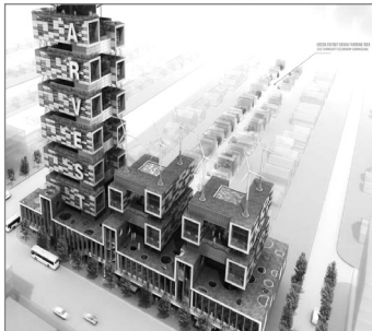
Harvest Green Project