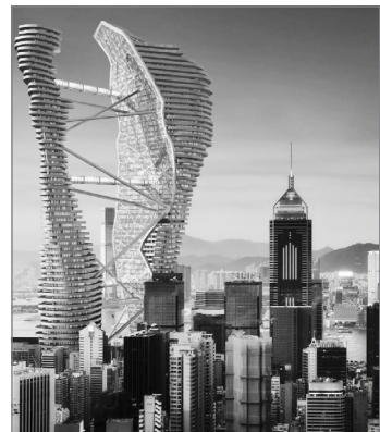
Terraced Twin Skyscraper