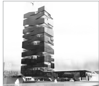
The Living Tower