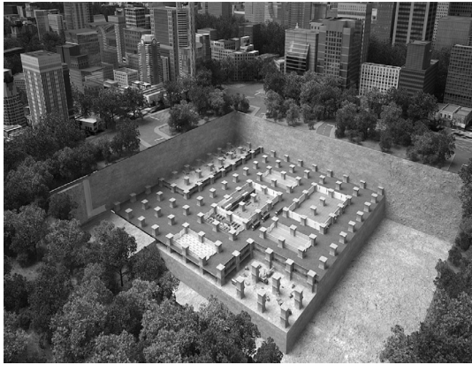
〈그림 5〉 격자형 대규모 지하 공간의 건설 개념(좌) 및 투시도(우)