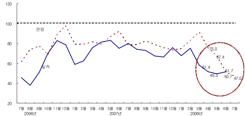
건설기업 경기실사지수(CBSI) 추이