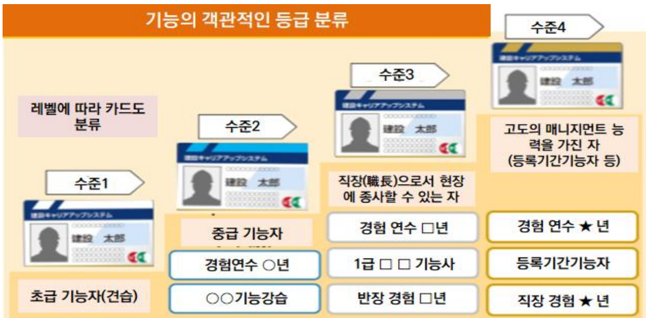
<그림1> 건설기능자 능력평가제도

주 : 전문공사업 단체 등이 직종별 능력평가 기준을 책정함. 자료 : 국토교통성.